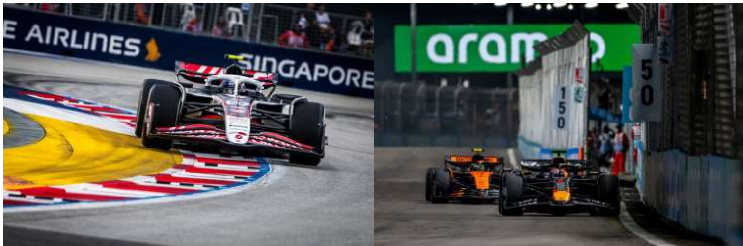
ชม รอบ SPRINT RACE + QUALIFYING

**เดินทางด้วยตนเอง เข้าร่วมงาน FORMULA 1 SINGAPORE GRAND PRIX 2026**