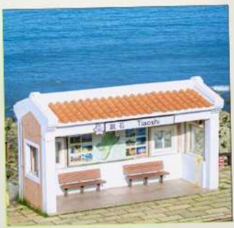
Tiaoshi Bus Station