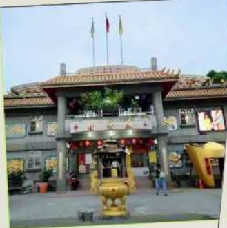
วัดจินซาน (โซคลาก)