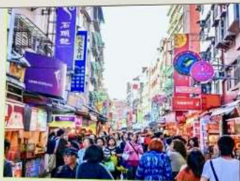
ถนนโบราณตื่นสุ่ย