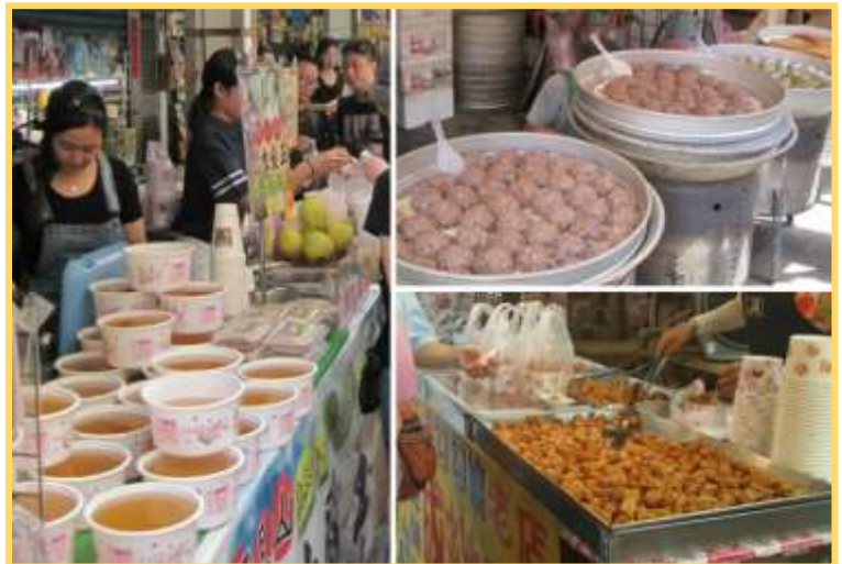
เที่ยง ๑๐ อีสระรับประทานอาหาร ร้านอาหารย่าน ถนนโบราณจินซาน (ไม่รวมค่าอาหาร)