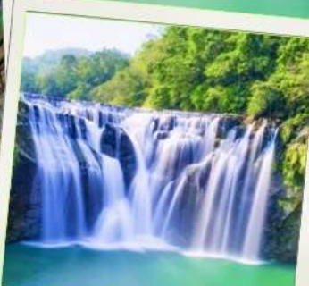
น้ำตกซือเฟิ่น