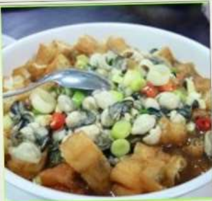
ถนนโบราณซือเฟิ่น