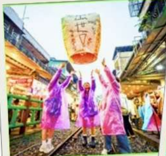
ปล่อยโคมลอย