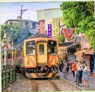
สถานีรถไฟซือเฟิ่น