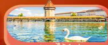
สะพานไมซ์ฮอป

Highlight เยือนหมู่บ้านแสนสวยเซอร์แมท เช็กอินศาลาไทยสุดงามที่โลซาน เที่ยวลูเซิร์น ชมสะพานไม้ชาเปลและอนุสาวรีย์สิงโต ซาลี แอปสทิน ชมประติมากรรม The Fork และปราสาทซิลลองริมทะเลสาบ เยือนมิลาน มหาวิหารดูโอโม เที่ยวเวนิส เมืองลอยน้ำสุดโรแมนติก อินกับรักอมตะที่บ้านจูเลียต และช้อปปิ้งจุใจที่ Serravalle Outlet