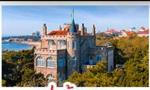
ป่าตักกวน

พระราชวังฤดูร้อน - วิวเมืองซิงเต่า รถไฟความเร็วสูง - ภูเขาเหลาซาน กำแพงเมืองจีนด้านจวียงกวน - ป่าตักกวน พักโรงแรมระดับ 4 ดาว - ไม่ลงร้านซื้อ มือพิเศษ เปิดปักกิ่ง , หม้อไฟซีฟู้ด