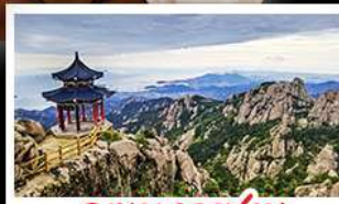
ภูเขาเหลาซาน