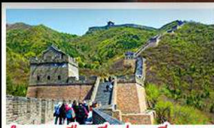
กำแพงเมืองจีนด้านจวียงกวน