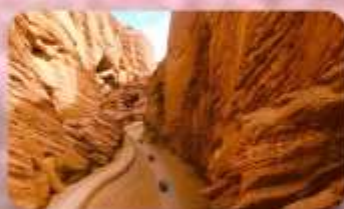
แกรนด์แคนยอนอาจูซือ