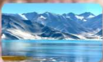
ทะเลสาบไป๋ซาหู