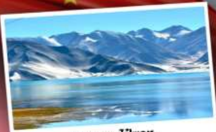
ทะเลสาบโปซาทุ

เปิดประตูสู่อารยธรรมพันปีแห่งซินเจียงใต้ ชมความสวยงามของหมู่บ้านดอกแอปเปิ้ล