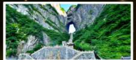
ทิวเขาประตูสวรรค์