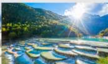
ทะเลสาบไป๋สุ่ยเหอ

*ทางบริษัทฯ ขอสงวนสิทธิ์ในการปรับเปลี่ยนโปรแกรมทัวร์ตามความเหมาะสมขึ้นอยู่กับสถานการณ์ปัจจุบัน โดยคำนึงถึงผลประโยชน์ของลูกค้าเป็นสำคัญ