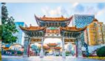
ประตูม้าก่องไถ่หยก