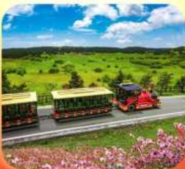
"อุทยานเขานางฟ้า"

บินตรงลงชิง • อุ่หลง หลุมฟ้าสะพานสวรรค์ • ระเบียงแก้ว • อุทยานเขานางฟ้า หงหยาดัง • นั้งรถไฟทะลุติ๊ก • ล่องเรือชมฉงชิ่งยามค่ำคืน • ศาลาประชาคม (ด้านนอก) มรดกโลกผาหินแกะสลักต้าจู้ • เมืองโบราณซือปาตี้ • วัดหลิวฮั่น • ตึกตะเกียบ