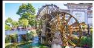
เมืองโบราณสี่จังหวัด

ถนนท่าคุณหมิง - ถนนสายดอกศรีตรัง หุบเขาพระจันทร์สีน้ำเงิน - อุทยานมิ่งกรหยก เมืองโบราณสี่จังหวัด - ทะเลสาบเอ๋อไห่ สวนน้ำตกคุณหมิง - รถมอเตอร์ไซด์