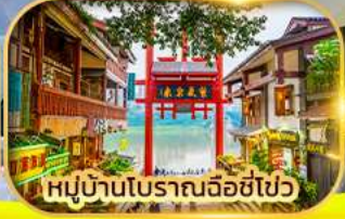
หมู่บ้านโบราณฉือชี่ไฉว