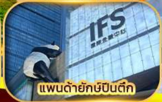
แพนด้ายักษ์ป็นตึก