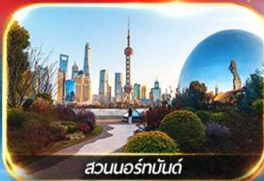
สวนนอร์มัลด์