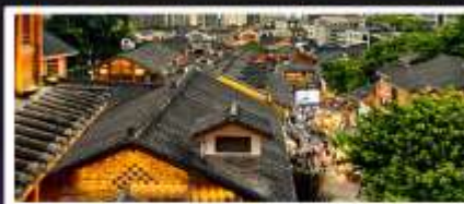
เมืองโบราณสี่ปาที้