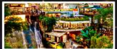
ถนนโบราณหลงเหมินฮ่าว