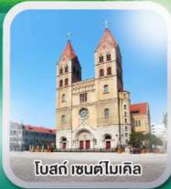
โบสถ์เซนต์โฆเซ