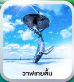
วาฬเกยตื้น