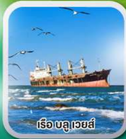
เรือบลูเวย์ส์