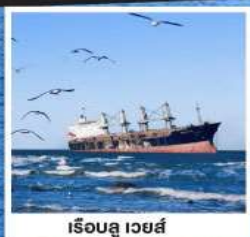
เรือลู่เว่ยส์