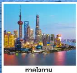
หาดไวทาน