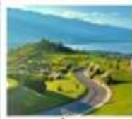
ภูเขาอวี่นเซียงชาน