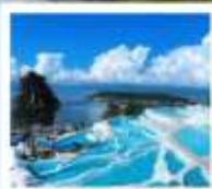
ซานโตรินี่ต้าหลี่

“เกาะเสี้ยวฉู...เกาะลึกลับกลางทะเลสาบ เอ้อไห้”