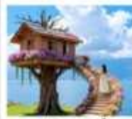
หมู่บ้านเหวินปี้