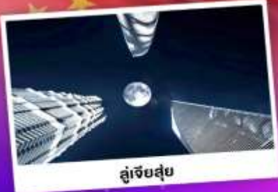
ดูเจ็ทสูย