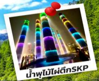
น้ำพุไม้ไฟตึกSKP

อุทยานปี้เผิงโกว อุทยานจิวจ้ายโกว 6 วัน 5 คืน