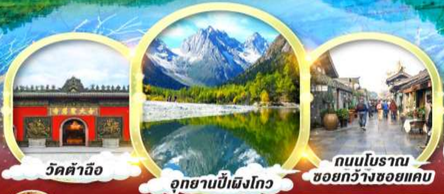
วัดต้าอื่อ