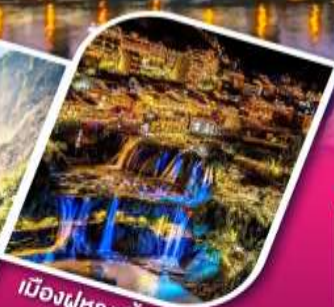
เมืองฝูหลงจิ้น