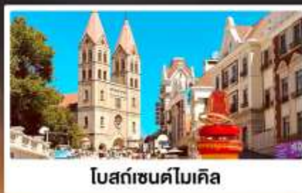
โบสถ์เซนต์ไมเคิล