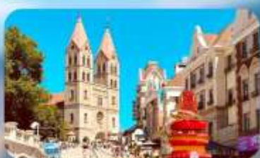
โบสถ์เซนต์โมเคิล