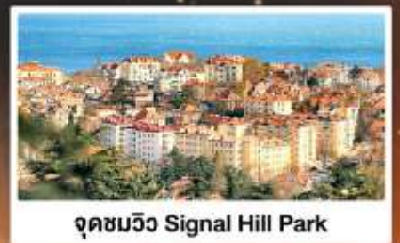
จุดชมวิว Signal Hill Park