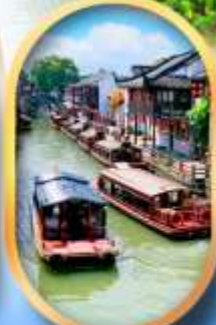
ถนนชานกั๊งเจีย