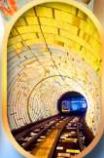
อุโมงค์แม่เหล็ก