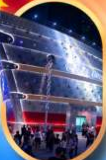
เรือคองฟู