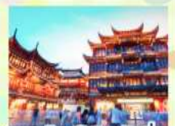
ตลาดร้อยปี เติ้งหวงเหมียว