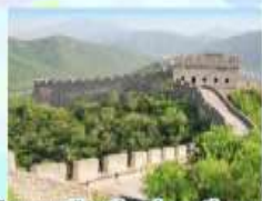
กำแพงเมืองจีน ด้านจวิยงทง