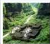
หลุมฟ้าสพานสวรรค์