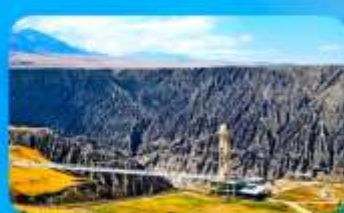
แกรนด์แคนยอนคูชานจื่อ