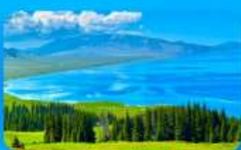
ทะเลสาบไซ่หลี่มู่