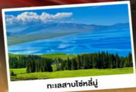
ทะเลสาบไซทาลีนู

ชมวิวสุดอลังการแบบยุโรปผสมเอเชีย กุ๋นหนุ่ยจ้านราถี้ ทะเลสาบสีเทอร์ควอยซ์