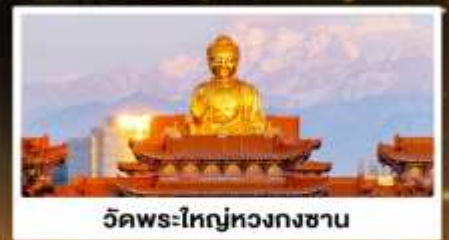
วัดพระใหญ่หวงกงซาน