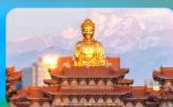
วัดพระใหญ่หวงกงชาน