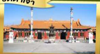
วัดต้าจา