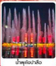
น้ำพุคังปาสือ