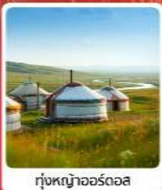
ทุ่งหญ้าออร์ดอส