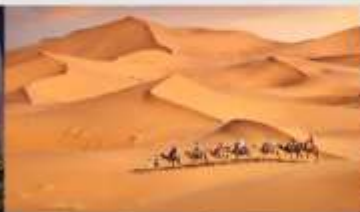
ทะเลทรายเสียงชวาม