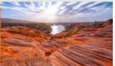
อุทยานหุบเขาคีลิน

*ทางบริษัทฯ ขอสงวนสิทธิ์ในการสืบโปรแกรมทัวร์ตามความเหมาะสมขึ้นอยู่กับสถานการณ์ทำงาน โดยค่าเดินทางผลประโยชน์ของลูกค้าเป็นสำคัญ