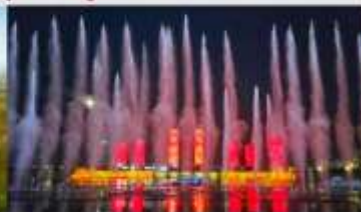
น้ำพุคังปาซือ