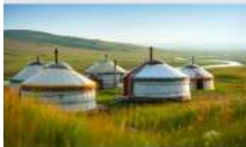
ทุ่งหน้าออร์ดอส