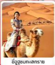
ขี่อูฐชมทะเลทราย