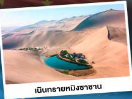
เนินทรายหิงซาซาน