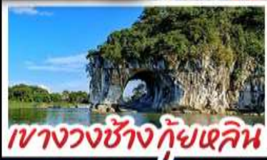
เขางวงช้าง กุ้ยหลัน