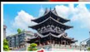
เจดีย์หยงชาน