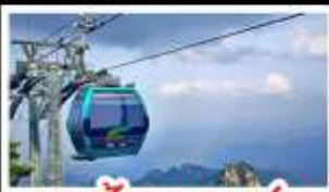
กระเช้าเขาหยงชาน