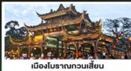
เมืองโบราณกวนเสียน