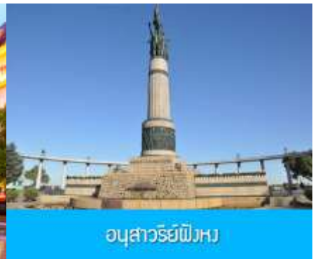
อนุสาวรีย์พิงหวง

หลังอาหารนำท่านชม โบสถ์ เซนต์โซเฟีย 索菲亚教堂 (ชมด้านนอก) อีกหนึ่งสัญลักษณ์ที่โดดเด่นของเมืองฮาร์บิน สร้างขึ้นในปี ค.ศ. 1907 เป็นโบสถ์คริสต์นิกายออร์ทอดอกซ์ ที่ใหญ่ที่สุดในเอเชียตะวันออกเฉียง ที่แสดงถึงอิทธิพลของวัฒนธรรมรัสเซียที่มีต่อเมืองฮาร์บิน