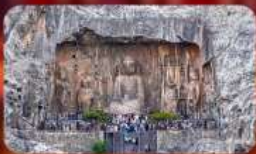
ถ้ำผาหลงเหมิน