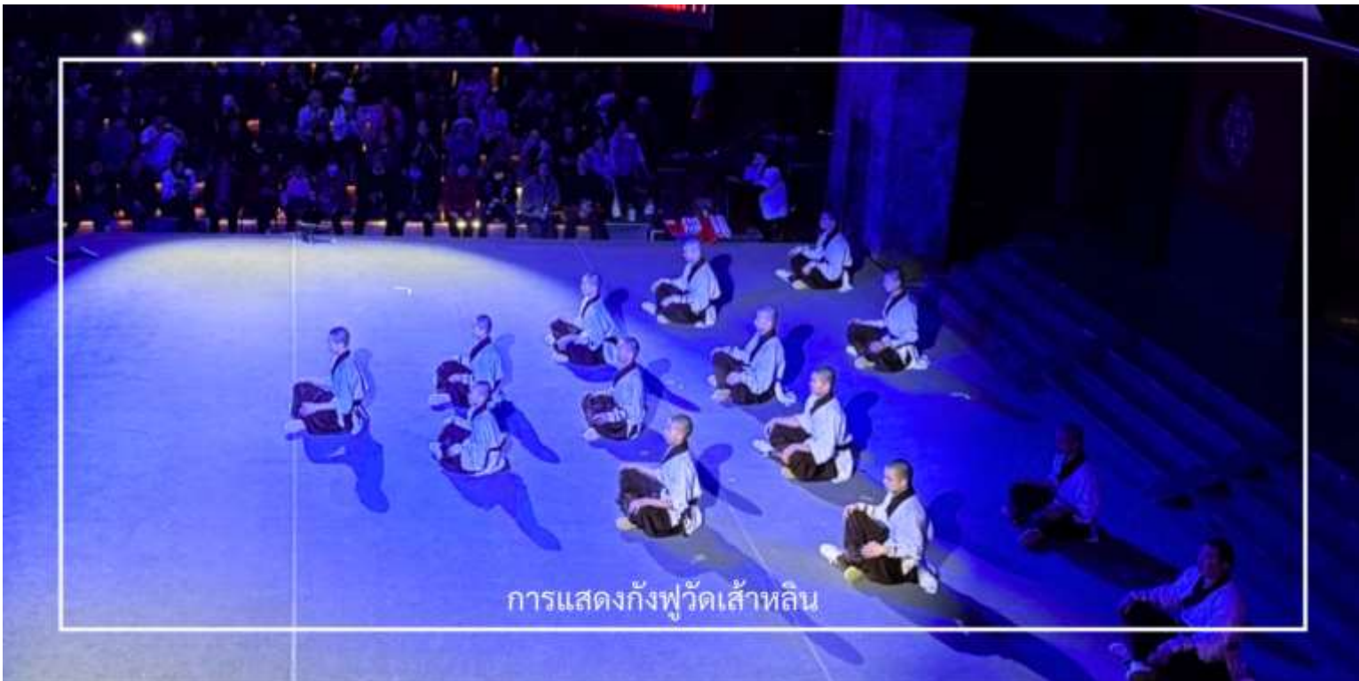
การแสดงกังฟูวัดเส้าหลิน

ไม่พลาด! กับประสบการณ์สุดพิเศษ ชมการแสดงกังฟูวัดเส้าหลิน ศิลปะการป้องกันตัวระดับตำนานที่เลื่องชื่อไปทั่วโลก การแสดงถ่ายทอดความแม่นยำ รวดเร็ว และแข็งแกร่งของวิทยายุทธเส้าหลิน ผ่านกระบวนท่าที่ได้รับแรงบันดาลใจจากสัตว์นานาชนิด เช่น เสือ งู กระเรียน ผสานเข้ากับการตีลังกา หมุนตัว และการควบคุมร่างกายอันน่าทึ่ง ด้วยแสง สี เสียง และดนตรีประกอบฉากที่จัดเต็ม ทำให้โชว์นี้เต็มไปด้วยพลังและความเร้าใจ นอกจากนี้ ผู้ชมยังมีโอกาสได้มีส่วนร่วมบนเวที เพิ่มความสนุกสนาน และประทับใจไม่รู้ลืม