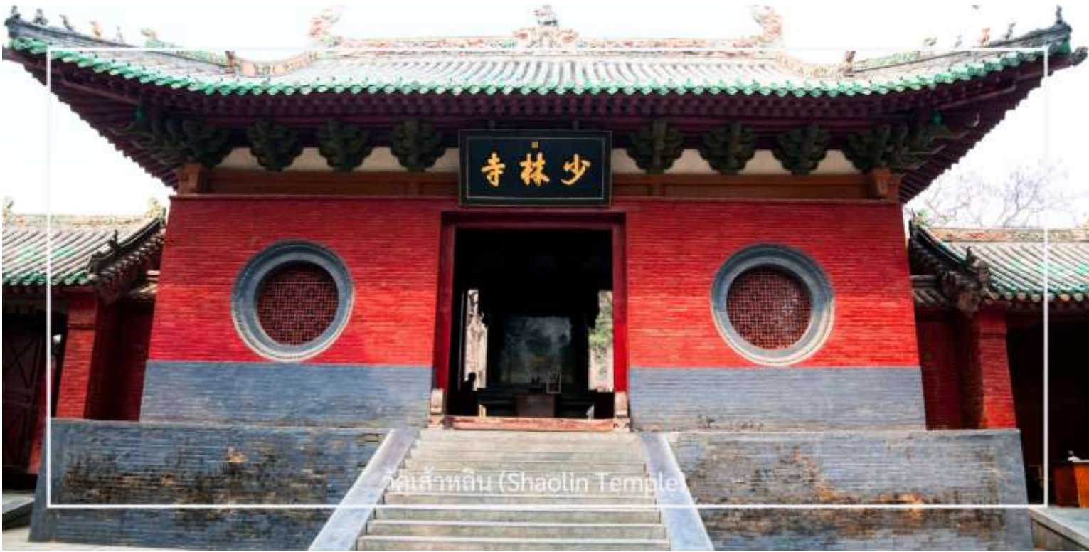
วัดเส้าหลิน (Shaolin Temple)

ไม่พลาด! กับประสบการณ์สุดพิเศษ ชมการแสดงกังฟูวัดเส้าหลิน ศิลปะการป้องกันตัวระดับตำนานที่เลื่องชื่อไปทั่วโลก การแสดงถ่ายทอดความแม่นยำ รวดเร็ว และแข็งแกร่งของวิทยายุทธเส้าหลิน ผ่านกระบวนท่าที่ได้รับแรงบันดาลใจจากสัตว์นานาชนิด เช่น เสือ งู กระเรียน ผสานเข้ากับการตีลังกา หมุนตัว และการควบคุมร่างกายอันน่าทึ่ง ด้วยแสง สี เสียง และดนตรีประกอบฉากที่จัดเต็ม ทำให้โชว์นี้เต็มไปด้วยพลังและความเร้าใจ นอกจากนี้ ผู้ชมยังมีโอกาสได้มีส่วนร่วมบนเวที เพิ่มความสนุกสนาน และประทับใจไม่รู้ลืม