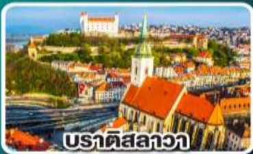
ปราตีสลาวา