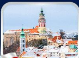
เมืองเชสกี ลุมลอฟ