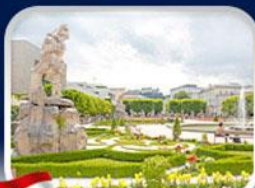
สวนมิรานา ซาลซ์บวร์ก