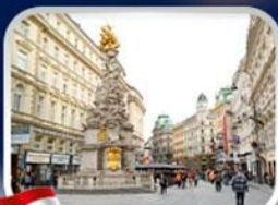
ซ็อบบิวการ์ทเนอร์สตรีก