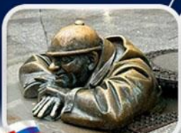
ประติมากรรม Cumil

มาเรียนพลักซ์·บ้านเกิดโมสาร์ท·พระราชวังฮอฟบวร์ก·ซาลส์บวร์ก·บ้านเกิดโมสาร์ท·เกรโกเดรสตรีก·ทะเลสาบคอนิกซ์·หมู่บ้านอัลส์สตัดท์·อนุสาวรีย์มาเรียเทเรซา