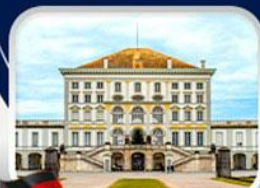
พระราชวังนิมเฟนบวร์ก