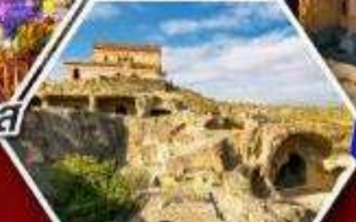
เมืองถ้ำอพลิสต์ซิคห์