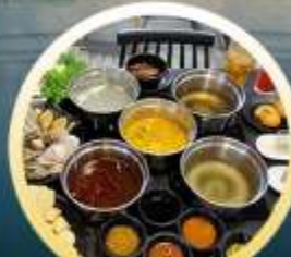
ชาบูฮ่องกง

02-04 มิ.ย. 18-20 มิ.ย. 07-09 มิ.ย. 20-22 มิ.ย. 13-15 มิ.ย. 25-27 มิ.ย. 14-16 มิ.ย. 28-30 มิ.ย.