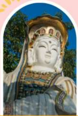
ริพลัสเบย์