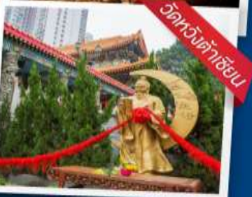
วัดหนว้ค้ำฮิย