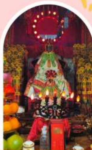
วัดเจ้าแม่กวนอิมอ่องฮำ

ความสำเร็จ ความมั่งคั่ง เงินทองไหลมาเทมา