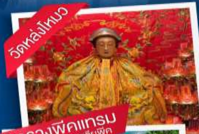
วัดหล่งโถง รกรางพีคแทรน ศูนย์คณาวิศตอเรือพิศ