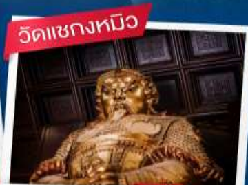
วัดเซกทมิว