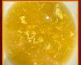
ซุปรข้าวโพด