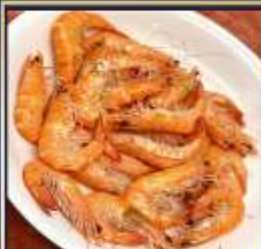
กุ้งหวานลวก