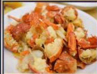
กุ้งมังกรอบซีส