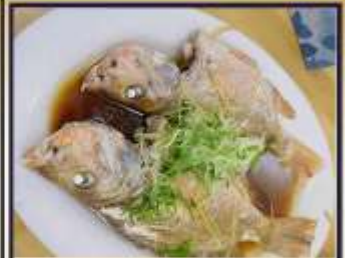
ปลาหนึ่งซีอิ๊ว