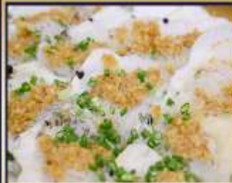
หอยเชลล์อบวุ้นเส้น