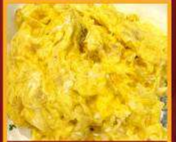
ไข่เจียวทรงเครื่อง