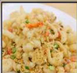
หมึกทอดกระเทียม