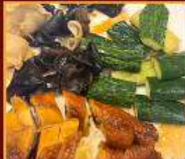
ไก่ แดงกวา เห็ดหูหนู