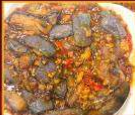
มะเขืออบหม้อดิน