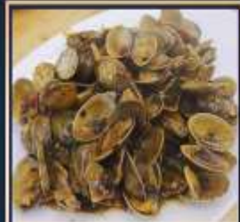
ผัดหอยลาย