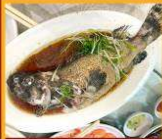
ปลาหนึ่งซีอิ๊ว