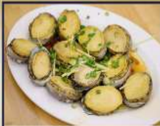
เป๋าฮื้อสดนึ่ง