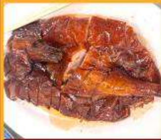
ท่านอย่าง