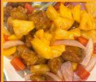
กระดุกหมูผัดเปรี้ยวหวาน