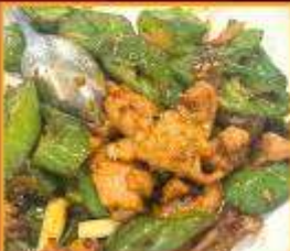
หมูผัดพริกหยวก