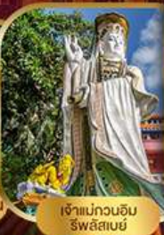
เจ้าแม่กวนอิม ริฟลิสซีย์