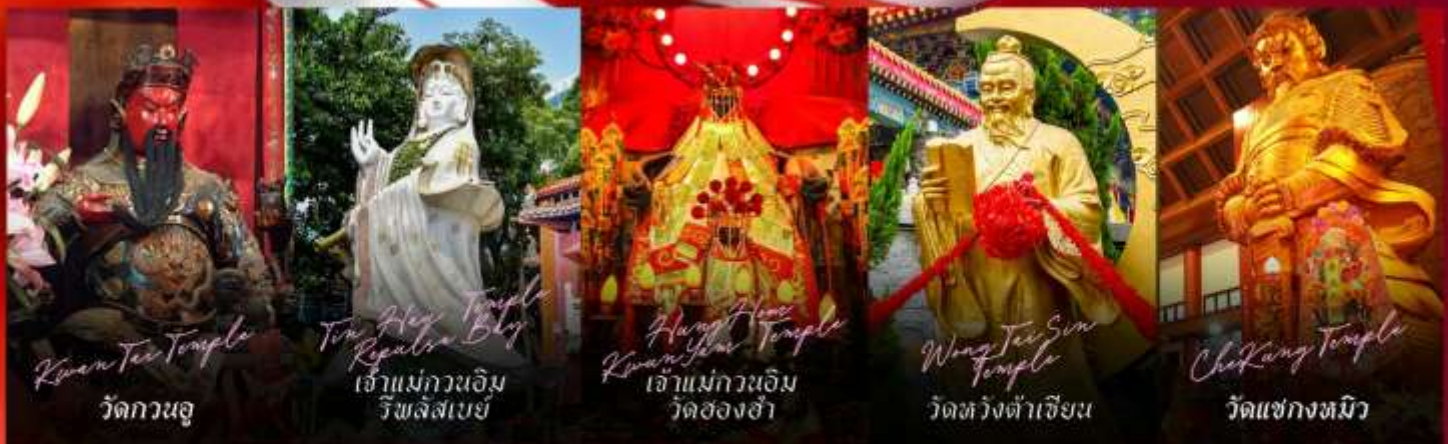
Kwan Tai Temple วัดกวนอู

รายการทัวร์ข้างต้นอาจมีการปรับเปลี่ยนเพื่อความเหมาะสม