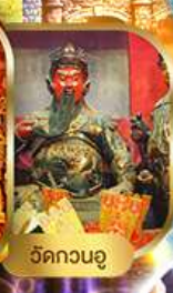
วัดกวนอู