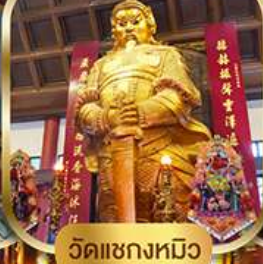
วัดแฉกงหมิว