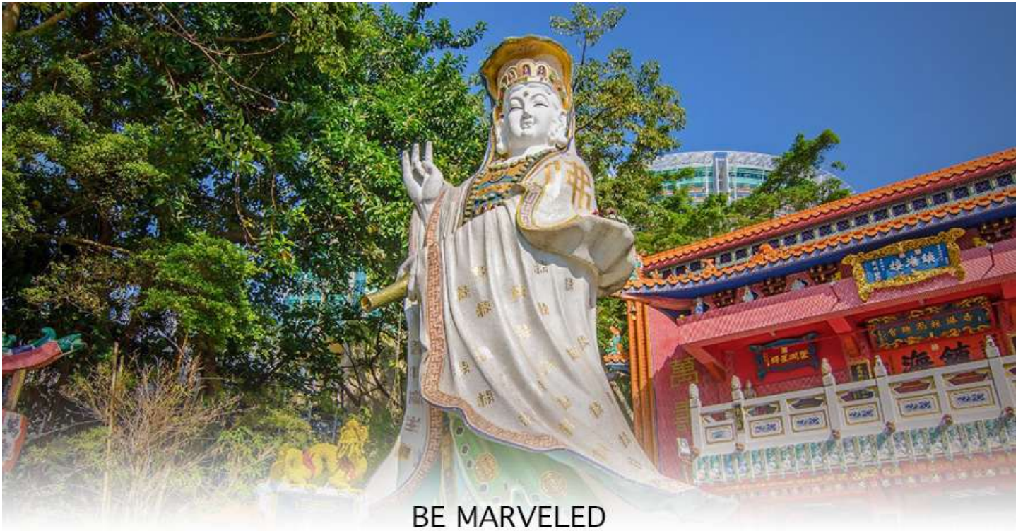
BE MARVELED วัดเจ้าแม่กวนอิมริพลัสเบีย