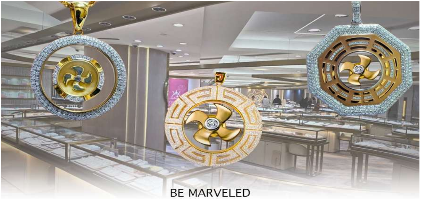
BE MARVELED ศูนย์ฮวงจุ้ย กัททันเศรษฐี

นำท่านชม ศูนย์ฮวงจุ้ย กัททันเศรษฐี ที่ขึ้นชื่อของฮ่องกง ท่านจะได้พบกับงานดีไซน์ที่ได้รับรางวัลยอดเยี่ยม และใช้ในการเสริมดวงเรื่องฮวงจุ้ย โดยการย่อใบพัดของกังหันที่เป็นสัญลักษณ์ของวัดวัดเซ่งหิมิว มาทำเป็นเครื่องประดับ ไม่ว่าจะเป็นจี้, แหวน, กำไล หรือต่างหูเพื่อเป็นเครื่องประดับติดตัว และเสริมดวงชะตา ซึ่งสินค้าทุกชนิด มีเอกสาร รับประกันคุณภาพเปลี่ยนหรือซ่อม ได้ตลอดอายุการใช้งาน หากเกิดการชำรุดจากสินค้าไม่ใช่อุบัติเหตุ