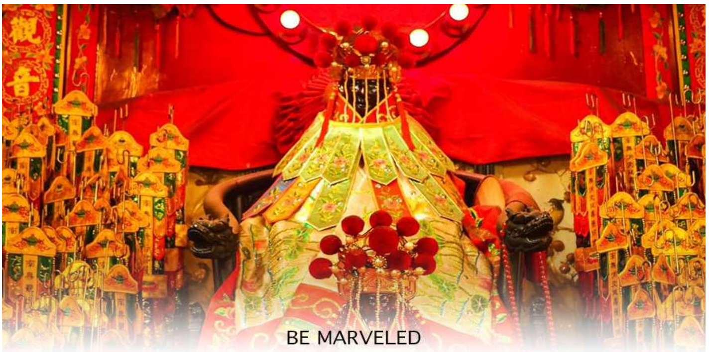
BE MARVELED วัดเจ้าแม่กวนอิมสองอำ (ยิมฮิน)

จากนั้นนำท่านสู่ เจ้าแม่กวนอิม วัดสองอำ (HUNG HOM KWUN YUM TEMPLE) เป็นหนึ่งในวัดที่เก่าแก่ที่สุดของฮ่องกง และชาวฮ่องกงเลื่อมใสกันมาก สร้างขึ้นในปี ค.ศ.1873 ในสมัยช่วงสงครามโลกครั้งที่ 2 มีการปล่อยระเบิดลงบริเวณใกล้กับวัดแห่งนี้หลายต่อหลายครั้ง ทำให้มีผู้บาดเจ็บและล้มตายมากมาย แต่ชาวบ้านที่หนีเข้าไปหลบภัยในวัดนี้ก็กลับปลอดภัยอย่างปาฏิหาริย์ และตัววัดก็ไม่ได้ได้รับความเสียหายจากเหตุการณ์ทิ้งระเบิดอย่างน่าอัศจรรย์ ตามความเชื่อของคนจีนใน ฮ่องกง-มาเก๊า จะมี "วันเปิดทรัพย์" หรือ "พิธียืมเงิน เจ้าแม่กวนอิมฮ่องกง" เป็นวันที่จะมาขอพรและยืมเงินเจ้าแม่กวนอิม ซึ่งนับจากหลังวันตรุษจีน ไป 26 วัน จะเป็นวันเปิดทรัพย์ที่จัดขึ้นในทุกๆปี พิธีนี้จะมีเพียงครั้งปีละครั้งเท่านั้น เป็นวันสำคัญอีกวันที่คนหลังไหลมาไหว้ขอพรอย่างไม่ขาดสาย