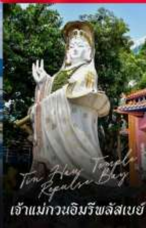
Tin Hau Temple เจ้าแม่กวนอิมรัชลิสเบย์