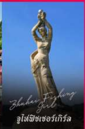
Zhuhai Fighting Girl จูไห่พิชเชอร์เกิร์ล