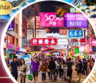
Shopping Tsim Sha Tsui