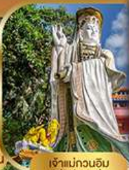
เจ้าแม่กวนอิม ริวฮัสนยี่