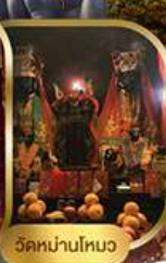
วัดนานโหมว