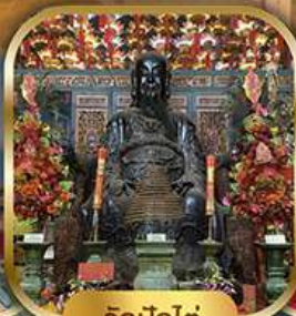
วัดปึกใต้