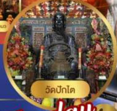
วัดปึกโต