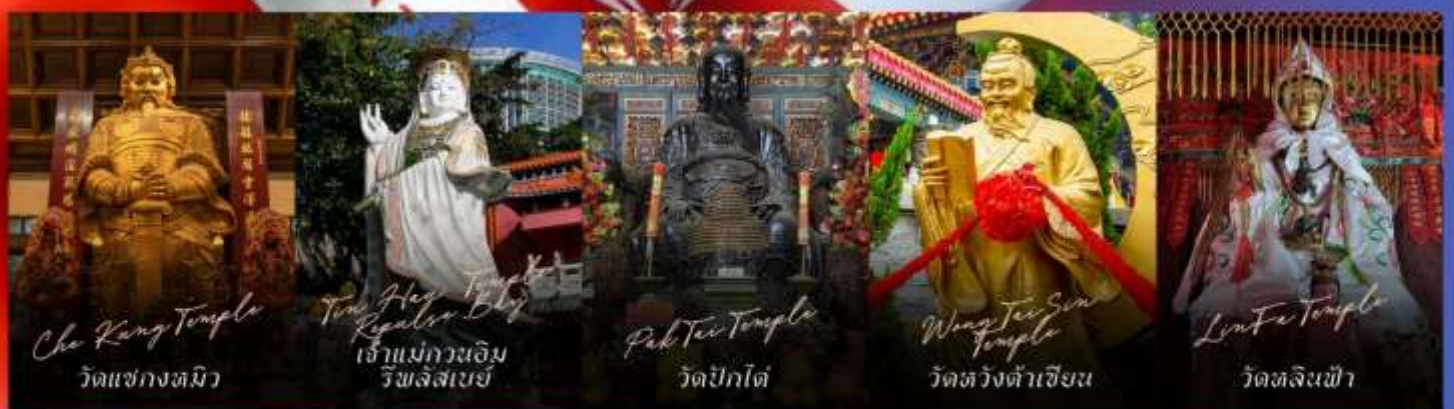
Che Kung Temple วัดเซกทมิว

รายการทัวร์ข้างต้นอาจมีการปรับเปลี่ยนเพื่อความเหมาะสม