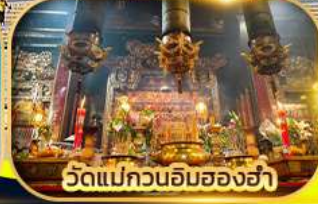
วัดแม่กวนอิมสองอ่า