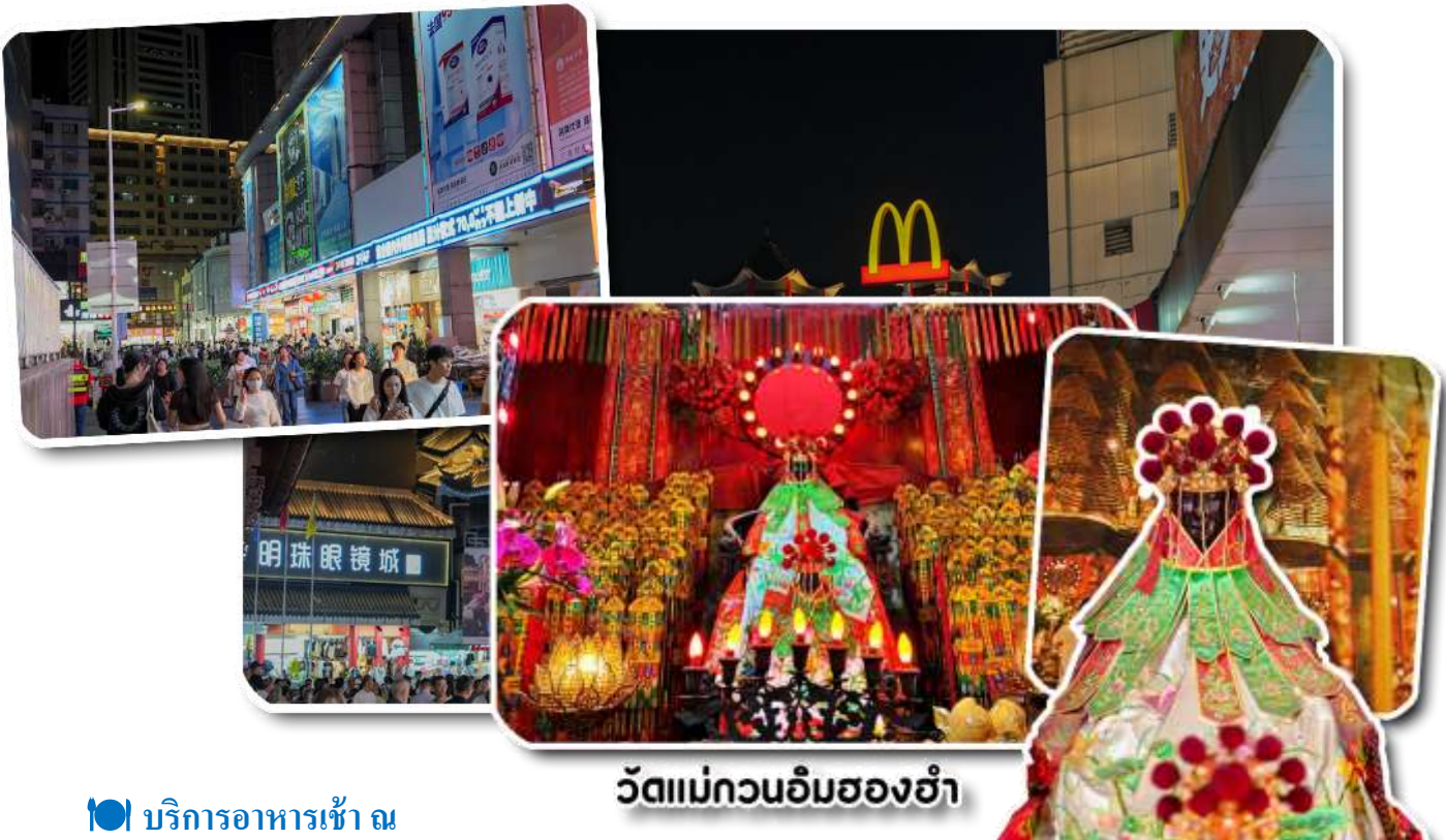
วัดแม่กวนอิมสองอ้า

ฮ่องกง - แม่กวนอิมสองอ้า - วัดปักไต้ - ร้านกั้งหัน - ร้านหยก - วัดแขก - ซุปปิ้งจิมซาจู้ - สนามบิน ( B/L/X )