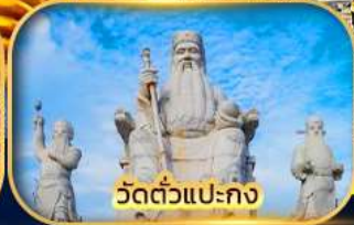
วัดตัวแปะกง