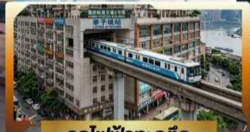
รถไฟฟ้ากะลุดัก