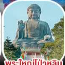
วัดหวงต้าเซียน