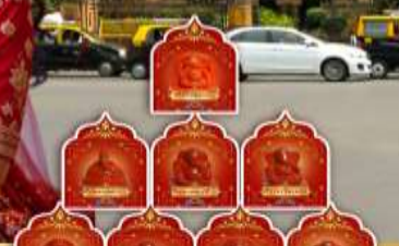
พระพิฆเนศ 8 องค์ เมืองปูเน่