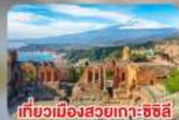
เที่ยวเมืองสวยเกาะซิซิลี Taormina