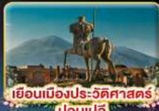
เยือนเมืองประวัติศาสตร์ ปอมเปอี