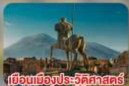
เยือนเมืองประวัติศาสตร์ ปอมเปอี