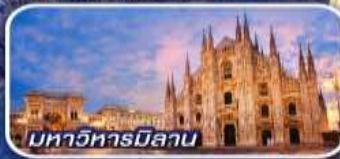
มหาวิหารมิลาน